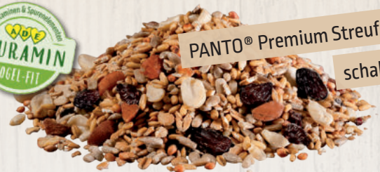
PANTO® Premium Streufutter schalenlos