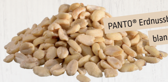
PANTO® Erdnussbruch blanchiert

Erhältlich in: 1 kg- / 2,5 kg-Beutel / 25 kg-Sack