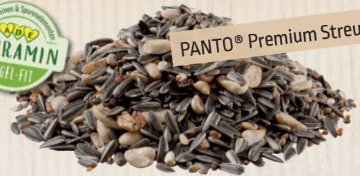
PANTO® Premium Streufutter