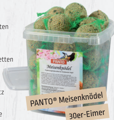
PANTO® Meisenknödel 30er-Eimer